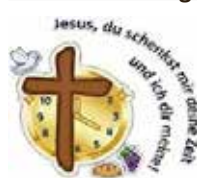
Foto: Logo der Erstkommunion der Winkelgemeinden

Am Freitag, 20.03.2026 treffen sich die Erstkommunionkinder von 14.30 Uhr bis 16.00 Uhr zum Bastelnachmittag in Munderkingen.